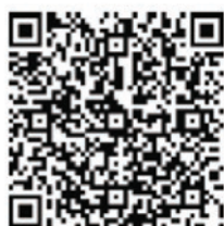
Uvedený QR kód vedie na Etickú linku UpDJ/ UpSK.

Môže tiež kontaktovať Etickú linku, ktorá je k dispozícii po prihlásení spolupracovníka do Office+365.