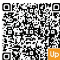
Uvedený QR kód vedie na Etickú linku Skupiny.

Všetky hlásenia na Etickú linku budú prijaté s vážnosťou a budú zadokumentované pre potreby Skupiny.